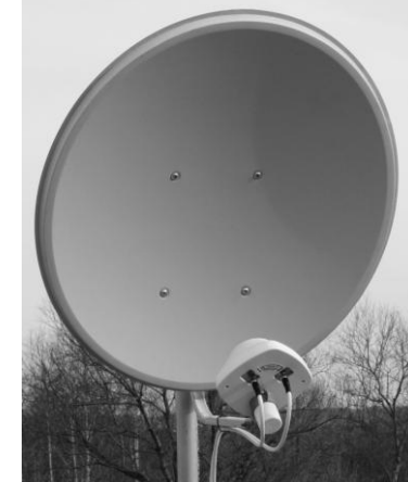
Рисунок 3. Установленный на «тарелку» облучатель с подключенными к нему соединительными кабелями.

3. Подключите нижний разъем (5) кабеля снижения (6) к разъему (3) антенного адаптера (4) (рис.2). Разъем (7) антенного адаптера вставьте в антенное гнездо (8) модема (1). Подключите модем (1) к компьютеру через USB-удлинитель (2). Аналогично подключите второй кабель снижения к модему через второй адаптер. Установите и запустите программу, поставляемую с модемом на вашем ПК. В настройках сети установите желаемый стандарт связи по умолчанию, например, "Только 4G/3G" или "Only LTE/3G".